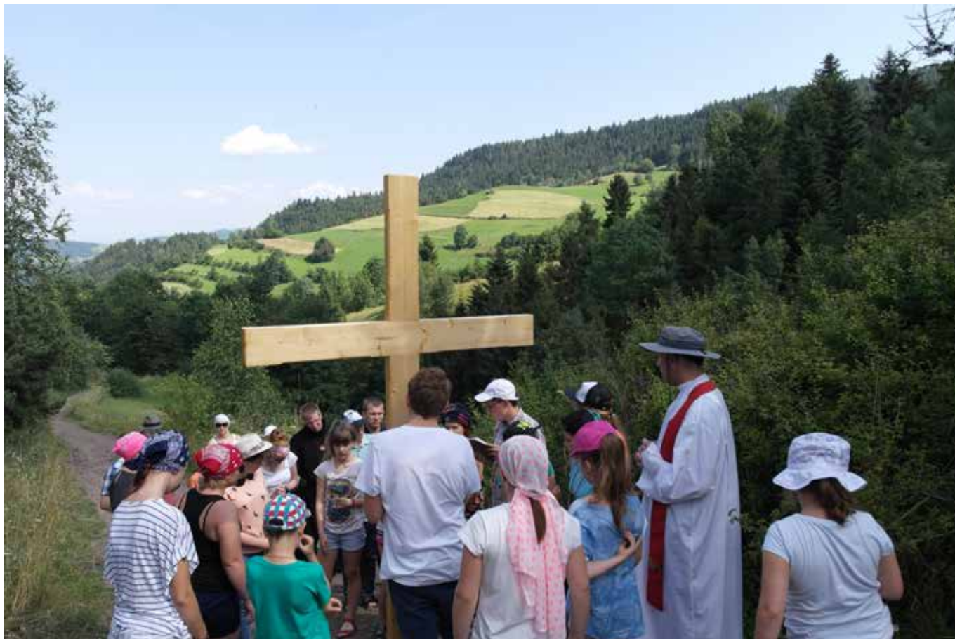
Droga krzyżowa. 19 lipca 2014 r.

polskich oraz zaczerpnęliśmy nieco z historii naszego kraju. Byliśmy w zimowej stolicy naszej Ojczyzny, a więc w Zakopanem, pojechaliśmy do Wadowic, gdzie nawiedziliśmy kościół Ofiarowania Najświętszej Maryi Panny, w którym był ochrzczony św. Jan Paweł II oraz zwiedzaliśmy nowe Muzeum – Dom Rodzinny Jana Pawła II. Tego samego dnia, wracając z Wadowic, wstąpiliśmy do Sanktuarium w Kalwarii Zebrzydowskiej, zwiedzając klasztor ojców bernardynów oraz modląc się przed cudownym obrazem Matki Bożej. Dwa razy odwiedziliśmy Krościenko nad Dunajcem – siedzibę Ruchu Światło Życie. Podczas pierwszej wizyty uczestniczyliśmy w dniu wspólnoty Oazy Żywego Kościoła, na który zjecha-