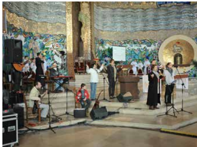
Rekolekcje, niedziela, 6 kwietnia 2014 r.

jest potężny. Często po ludzku myślimy, że zło zwyciężyło, ale wygranym jest Chrystus. W tej walce jeszcze jest człowiek. Ja jako człowiek mogę złemu nadać moc. Daję siłę każdej pokusie, gdy się nią zajmuję. Gdy jednak odwracam oblicze w stronę Boga, On staje się moją siłą. Zło jednak nadal nęci i ja nadaję mu moc gdy się nim zajmuję. Zły jest dobrym reklamodawcą, potrafi sprzedać najgorszy towar za cenę jedności z Bogiem. Jedyna moja nadzieja to patrzeć na Jezusa, On jest mocą, On jest wszystkim.