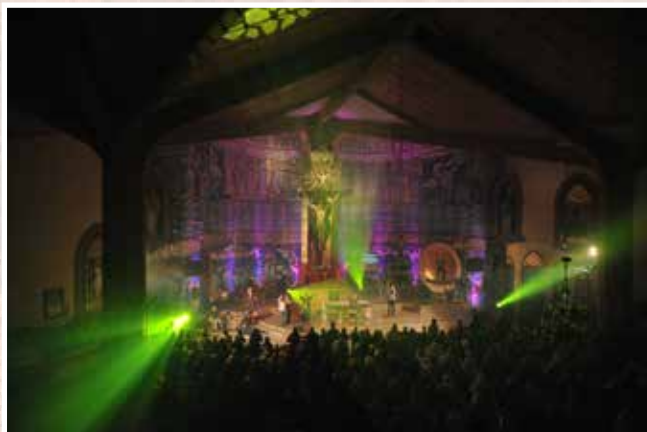
Koncert, niedziela, 6 kwietnia 2014 r. godzina 19:00.

czej: w kategoriach grzechu demona widzę na ziemi, w kategoriach wolności widzę Boga na ziemi. A chrześcijanin jest człowiekiem, który widzi Boga na ziemi, bo demona każdy dostrzega, kto nie jest Chrystusem. Boga widzieć na ziemi to droga nawrócenia; dostrzegać Boga na ziemi w sytuacjach trudnych.