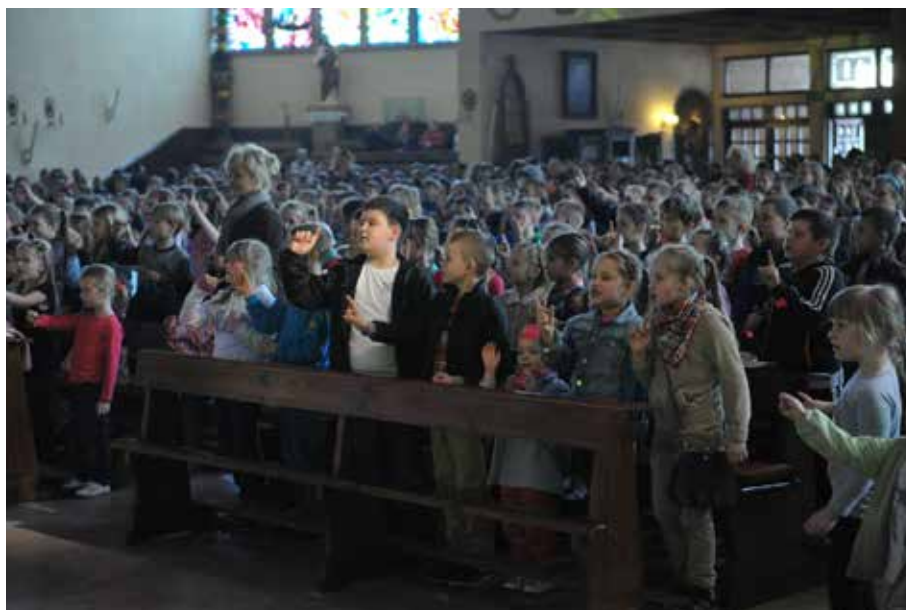
Rekolekcje dla dzieci, wtorek, 8 kwietnia 2014 r.

Powyżej przedstawione tematy towarzyszyły tegorocznym wielkopostnym spotkaniom rekolekcyjnym, które zakończyły się ostatniego dnia Mszą świętą z modlitwą o uzdrowienie. Co do tej ostatniej to musimy sobie ciągle uświadamiać, że każda Msza święta ma moc uzdrowienia, zawsze możemy o to się modlić, ale o tym często zapominamy. Na każdej Mszy Bóg uzdrawia, ale człowiek przychodzi inny