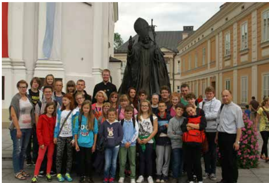
Wadowice, 18 lipca 2014 roku.

Oczywiście oprócz wszystkich tych punktów był czas na poznanie okolicy. Odwiedziliśmy Kraków, dawną stolicę Polski, siedzibę królów